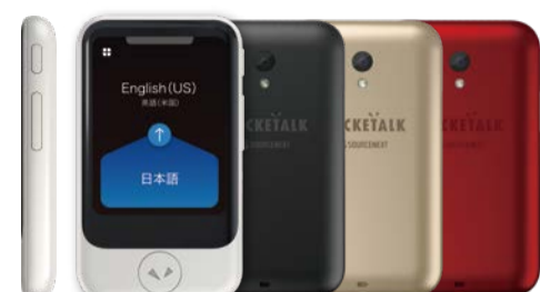
グローバル通信(2年)付き 32,780円(税込)

■本体サイズ: 幅 約53.8mm / 厚み 約11.5mm / 高さ 約91.6mm ■重量: 75g ■ディスプレイ: 2.8inch(解像度 640x480px) タッチパネル ■音声翻訳対応言語数: 74言語(55言語では音声とテキストに、19言語ではテキストに翻訳します。2019年11月時点) ■カメラ: リアカメラ800万画素オートフォーカス ■カメラ翻訳対応言語数: 55言語 ■スピーカー / マイク: 1.5Wスピーカー x2 / ノイズキャンセリング機能搭載デュアルマイク ■CPU: ARM Cortex53 Quad-Core 1.3GHz ■OS: Android OS 8.1のカスタマイズ OS ■メモリ: ROM 8GB / RAM 1GB ■充電端子: USB Type-C ■バッテリー: 1200mAh(リチウムイオン電池) ■連続待受時間: 約60時間(電波を正常に受信できる静止状態での平均時間。使用環境や設定などにより、連続待受時間は変動します) ■連続翻訳時間: 約270分(10分あたり5分間連続して翻訳を行ない、輝度50%、音量50%の状態でも繰り返した際の時間。使用環境や設定などにより、連続翻訳時間は変動します) ■充電時間: 約105分(本製品付属品の電源アダプタとケーブルを使用) ■ワット消費: 4.56Wh(顧客機待受時や空待時、リチウムイオン電池のワット消費量の提示が求められた場合はこの数値を報告してください) ■充電仕様: 入力電圧: 5V / 入力電流: 2Aまで ■Bluetooth: Bluetooth 4.2 ■SIMカードスロット: nano-SIM ■データ通信方式: 対応周波数帯: 3G-[W-CDMA] 1/2/5/6/19, 4G-[FDD-LTE] 1/2/3/5/7/8/18/19/20/26/28b, [TD-LTE] 38/39/40 ■Wi-Fi対応周波数: IEEE802.11a/b/g/n, 2.4GHz: 1 ~ 11ch, 5GHz: 5.2GHz(W52), 5.3GHz(W53), 5.6GHz(W56) 注)電波法で5.2GHz/5.3GHz帯(W52/W53)の屋外利用は禁止されています。必ず屋内で利用してください。(5.2GHz帯高出力データ通信システムの基地局又は陸上移動中継局と通信する場合は除きます) ■GPS: 搭載 ■動作環境: 動作温度: 0℃~40℃(結露がないこと) / 保存温度: -20℃~45℃(結露がないこと)