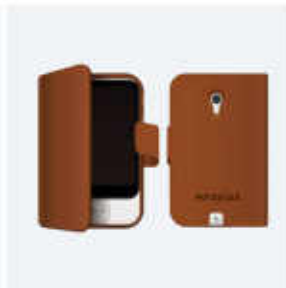
手帳型ケース (ブラウン)