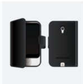
手帳型ケース (ブラック)