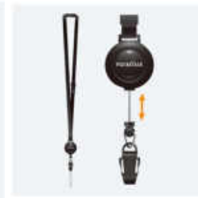
ネックストラップ