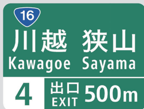
ヒラギノフォント(和文部分)を採用した新標識

高速道路において円滑な走行を支援するための案内標識には、何よりもドライバーへのわかりやすさが求められ、視認性は大変重要な要素です。「ヒラギノ角ゴシック体 W5」は、文字の端部が強調され未広がりになったデザイン、つぶれにくく遠くからも読みやすい点、他のゴシック体と比較して一つ一つの部首が明瞭で瞬間的に認識しやすいことなどが評価され、高速道路の案内標識の和文書体として採用されています。